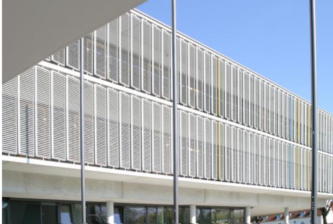
Ansicht des rechten Gebäudeflügels

Frischluff das ganze Jahr und sommerliche Nachtabkühlung über die Glasfassade - Ventomaxx ISO-Schiebelüftungssystem