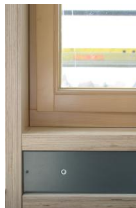
Die Lüfter sind über einen bauseitig isolierten Schacht revisionierbar.

Die Fassadenlüftung wurde bündig in die Glasfassade integriert. Ein umlaufendes Beschattungssystem verhindert übermäßige Aufheizung im Sommer und bietet tagsüber idealen Blendschutz; die Nachtauskühlung über die Lüftung sorgt zusätzlich für mehr Komfort und bringt auch in den wintermonaten vorkonditionierte Frischluff über die Heizkonvektoren in die Klassenräume.