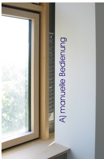
A) manuelle Bedienung