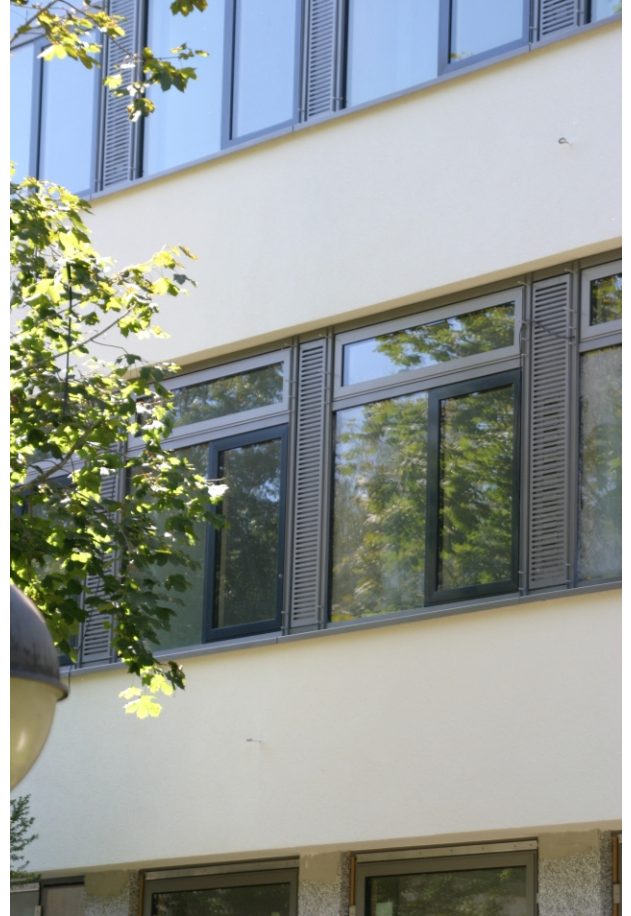
Oben: Ventomaxx-Lüfter im Alu-Sandwich-Panel eingefasst und zusammen mit dem äußeren Sichtschutz eingespannt.