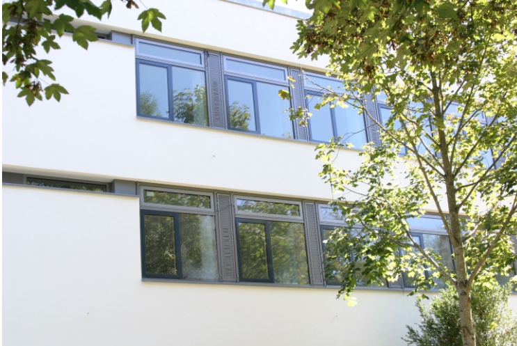
Teilansicht eines Gebäudeflügels

Frischluff das ganze Jahr und sommerliche Nachtabkühlung über die Glasfassade - Ventomaxx ISO-Schiebelüftungssystem