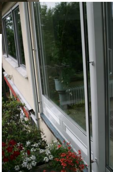
Aussenansicht Typ 2100

Über die Steuerzentrale kann sowohl die Lüftung als auch die Markise sowie der Sonnenschutz manuell oder vollautomatisch gesteuert werden.