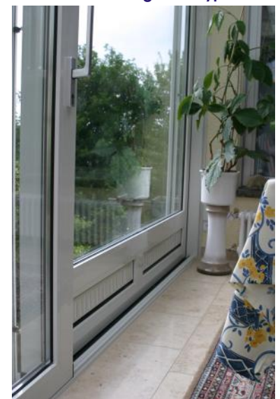
Innenansicht Typ 2100