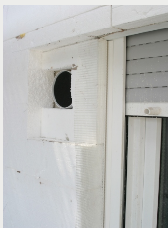
Schalldämmeinheit SDL 125 eingesetzt im VWS-System