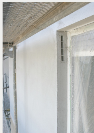
Laibungseinsatz Typ LAL während der Verputzarbeiten