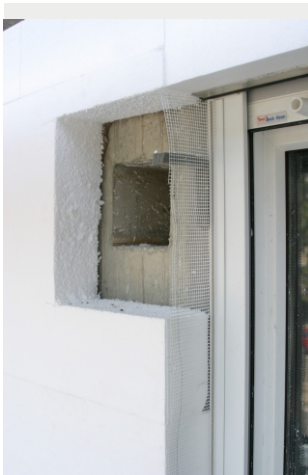
Aussparung der Rohbauöffnung aussen