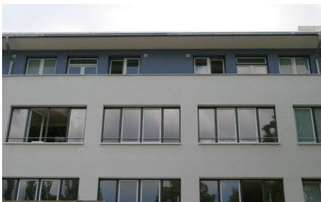
Verschiedene Fassadenansichten ...