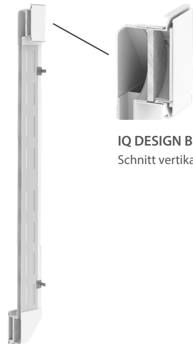
IQ DESIGN BLENDE Schnitt vertikal